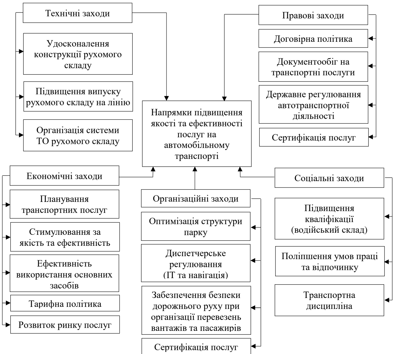
Рис. 2. Основні напрямки підвищення якості та ефективності послуг на автомобільному транспорті

Загалом, основними напрямками підвищення якості та ефективності послуг на автомобільному транспорті є реалізація низки заходів (рис. 2).