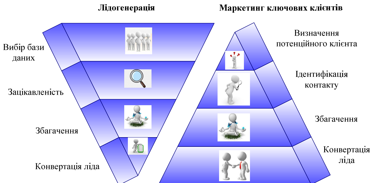
Рис. 2. Порівняння класичної воронки продажів та АВМ-воронки

У АВМ воронка починається «навпаки» – точка входу розташована на вершині конусу, оскільки потенційний клієнт теоретично ближчий до конверсії, ніж у класичному фреймворку лідогенерації (рис. 2).