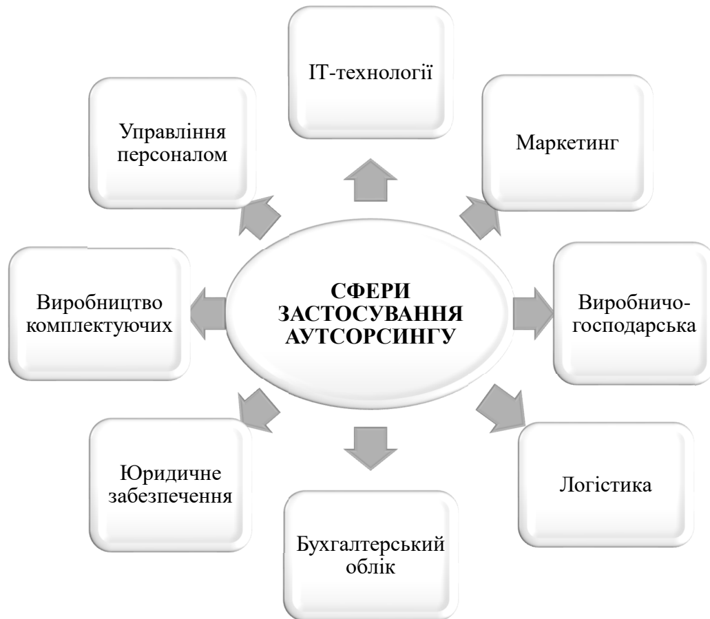
Рис. 1. Основні сфери застосування аутсорсингу (доповнено авторами на основі джерела [2])