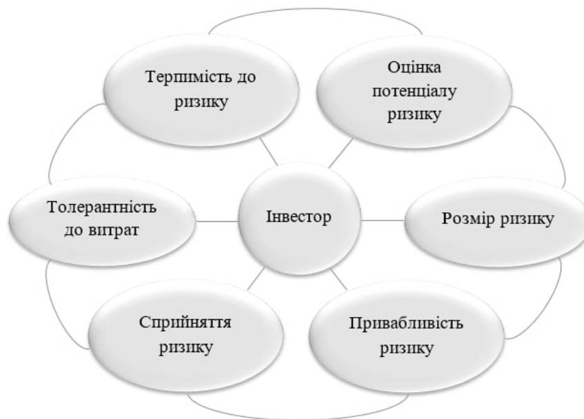
Рис. 1. Метод емпатії при формуванні профілю ризику

При складанні проєкту залучення інвестицій актуальним є проведення оцінювання ризику, де є раціональна та емоційна складові (рис. 1).