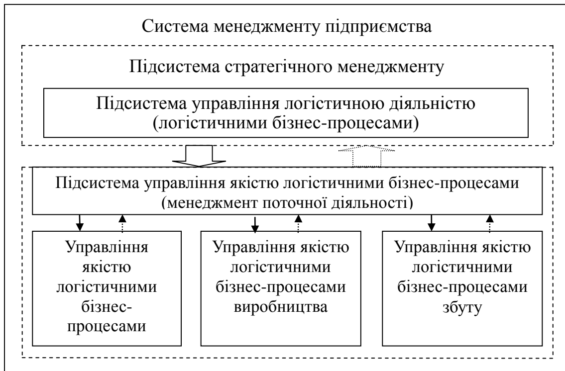
Рис. 1. Місце підсистеми управління якістю логістичними бізнес-процесами у загальній системі менеджменту підприємства

На основі обґрунтування місця системи управління якістю логістичними бізнес-процесами в загальній системі управління підприємством необхідно визначити її структуру та зміст.