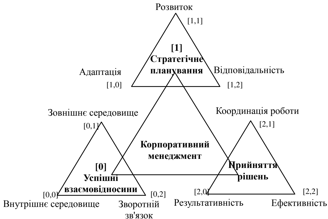
Рис. 2. Дворівневе тріадичне дешифрування поняття «корпоративний менеджмент»

[2] Прийняття рішень включають в себе: [2,0] результативність, [2,1] координацію роботи, [2,2] ефективність (рис. 2).