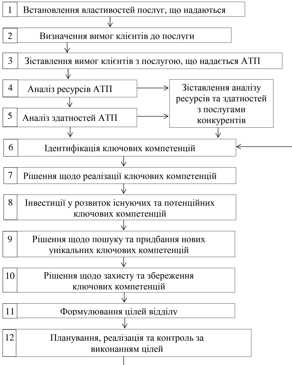
Рис. 1. Модель розробки стратегії бізнесу за допомогою ресурсного підходу

змушують врахувати і її особливі властивості. До них відносяться імідж, минулий досвід, можливі наслідки отримання якісної/неякісної послуги.