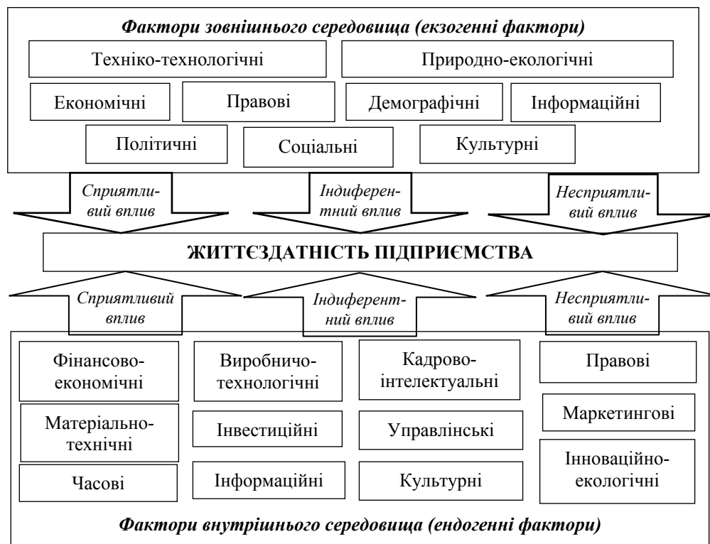
Рис. 3. Екзогенні та ендогенні фактори, що впливають на забезпечення життєздатності підприємства

Система факторів зовнішнього та внутрішнього середовищ, що впливають на забезпечення життєздатності підприємства наведені на рис. 3.