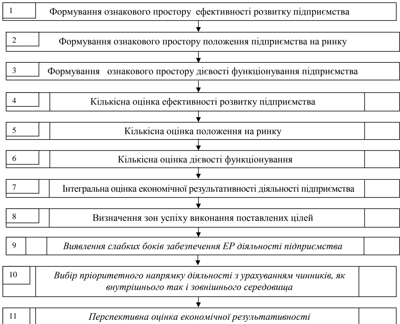
Рис. 2. Блок-схема удосконаленої комплексної оцінки ЕР підприємства

сконалений (рис. 2). Виконання першого та третього етапів включно здійснюється на підставі методичних основ викладених в роботі [25], реалізація четвертого та дев'ятого етапів включно здійснюється на підставі методичних основ викладених в роботі [4], методичні основи щодо здійснення виборупріоритетного напрямку діяльності з урахуванням чинників, як внутрішнього так і зовнішнього середовища розриті в роботі [26], перспективна оцінка економічної результативності потребує вибору, обґрунтування та розробки певних методичних підходів, це є подальшим напрямком наукових досліджень авторів роботи.