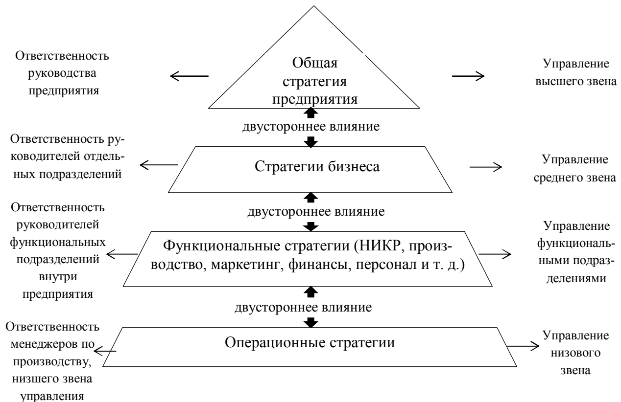
Рисунок 2 – Представление четырехуровневой организационной структуры стратегического управления

Представители второго подхода – ученые, авторы учебников и учебных пособий по стратегическому управлению: Ф. Дэвид, Д. Томпсон, Р. Линч, И. Ансофф, З. Шершенева, Б. Мизюк, С. Панов, В. Парахина предлагают четырехуровневую модель организационной структуры управления (рис. 2).